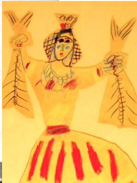
PICASSO EN SU CASA FRANCESA "LA CALIFORNIE". Y detalle de la obra "La Chumbera".

Ponemos el ejemplo de Pablo Ruiz Picasso como persona que siempre estuvo aprendiendo. Aprendía de cualquier cosa, y cualquier cosa le servía para encontrar la inspiración. Hasta las rasas de los pescados. También como ser humano que tenía todos los sentidos abiertos: para la música, la danza, la pintura, la escultura, el pesacado, el vino... Sí, llevaba un niño dentro con un hambre inagotable de diversión. Porque para aprender también hay que divertirse.